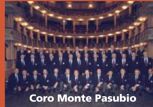
Coro Monte Pasubio