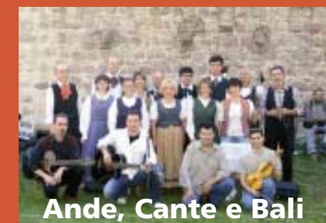
Ande, Cante e Bali