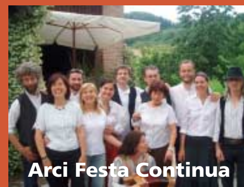
Arci Festa Continua