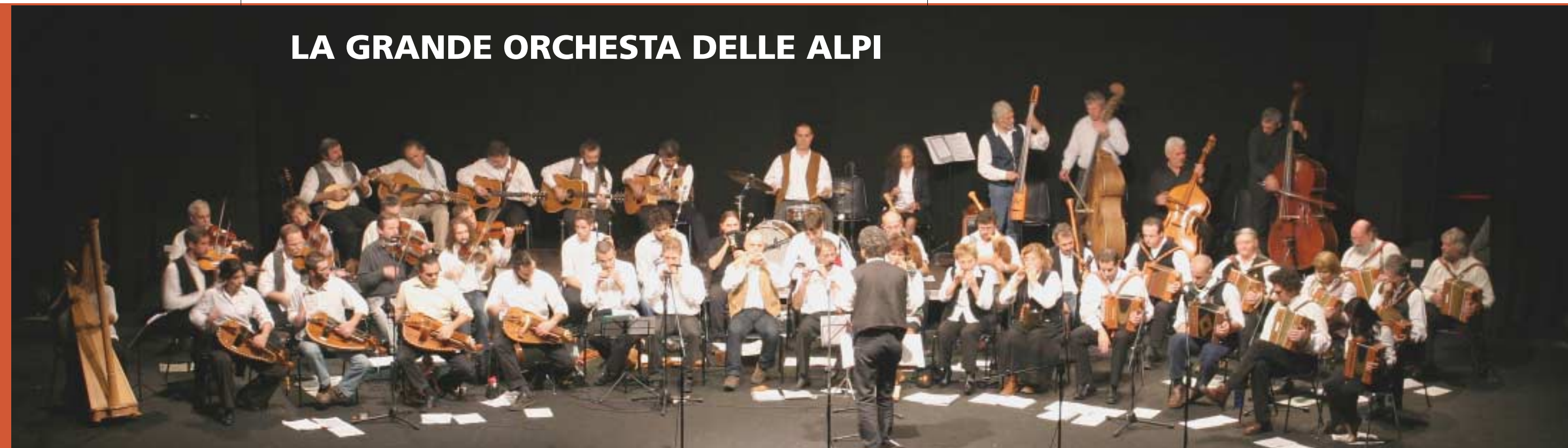
LA GRANDE ORCHESTRA DELLE ALPI